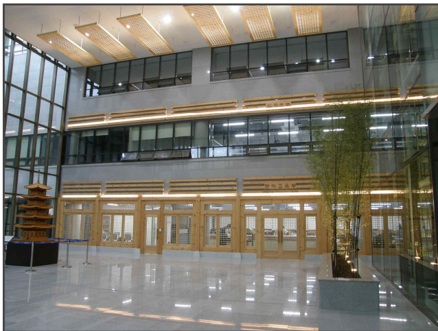
New Silk-Road Center

Korean Language Education Center(1st Floor) and Office of International Affairs(3rd Floor)